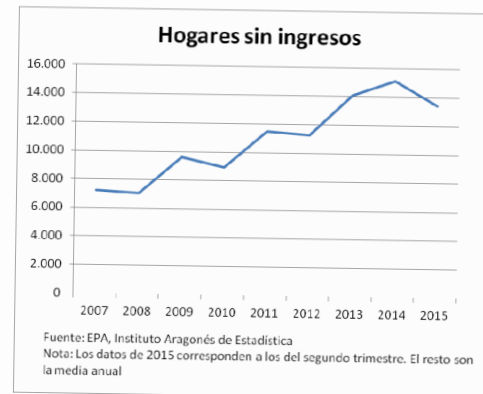
1. Hogares sin ingresos (2007-2015)

Hasta el 31/8/2015 se registraron 3.615 solicitudes de IAI.